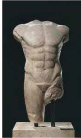
De torso van Apollo die Rilke in het Louvre zag. Hier het gedicht wat hij er over schreef.

Deze onvolmaaktheid en gebrekkigheid is de status quo van de mens. Daar moet hij iets aan doen. Dat doet hij door naar iets te streven. Daardoor ontstaat een 'verticale spanning' in hem. 'De mens', schrijft Sloterdijk, 'boekt alleen vooruitgang als hij zich richt op het onmogelijke'. Sloterdijk moet natuurlijk niets hebben van de oude verticaliteit zoals die door leeghoofdige aristocraten werd aangehangen. Bij Sloterdijk gaat het om de cultuur van de persoonlijke inspanning, om de dynamiek van meer willen weten, dieper willen graven, zichzelf op de proef willen stellen, meer moeite willen doen, meer uithoudingsvermogen tonen. De mens is een oefenbeest, volgens Sloterdijk, en om iets te bereiken moet hij oefenen en nog eens oefenen.